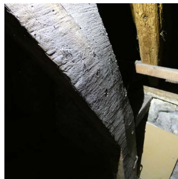
Dezelfde balk als op de vorige foto, maar dan de andere zijde, die een gezaagd oppervlak heeft.

Auteur en foto's: Willard van Reenen, bouwhistoricus en docent