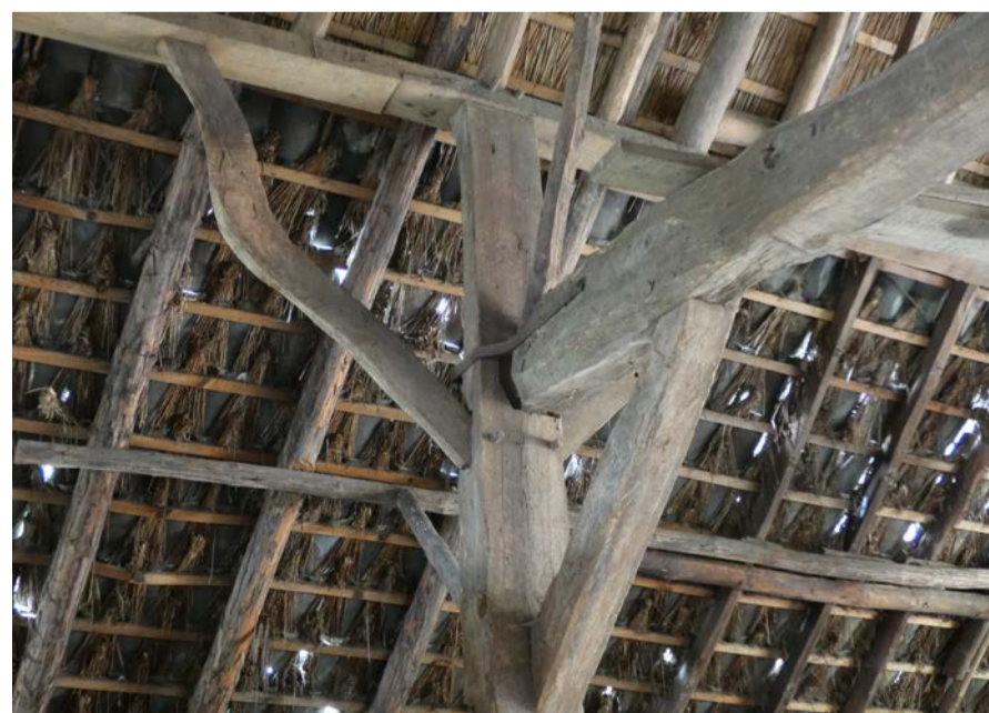
In oude houtconstructies komen allerlei variaties voor van bewerkt hout. Rondhout, bos-, wan- en meskant beslagen of gezaagd hout, maar ook kromgegroeid hout.

gen dat 1/4 - 1/3 van de balklengte nog volledig rond is. Wankant houdt in dat de balk nergens geheel rond is en nergens geheel recht. Meskant betekent over de volledige lengte overal rechte zijden. Soms liet men het worteleind aan de stam zitten en werd dat deel bewerkt tot een 'vast sleutelstuk' bij de oplegging in de muur.