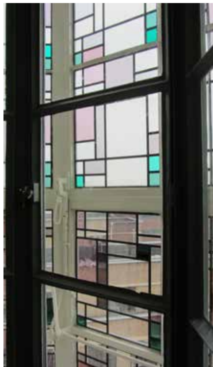
Het beeld dat je ziet als je vanuit de lift naar buiten kijkt.