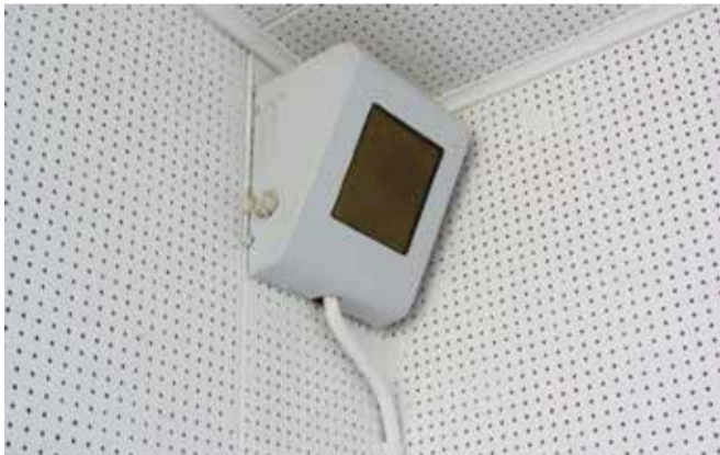
Twee voorbeelden van een intercom voor interne communicatie in een kantoor uit 1955.