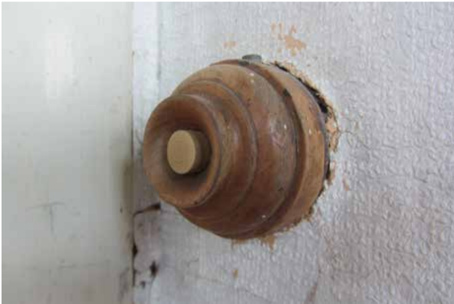
Een drukknop waarmee een huistelegraafinstallatie in werking gezet werd.