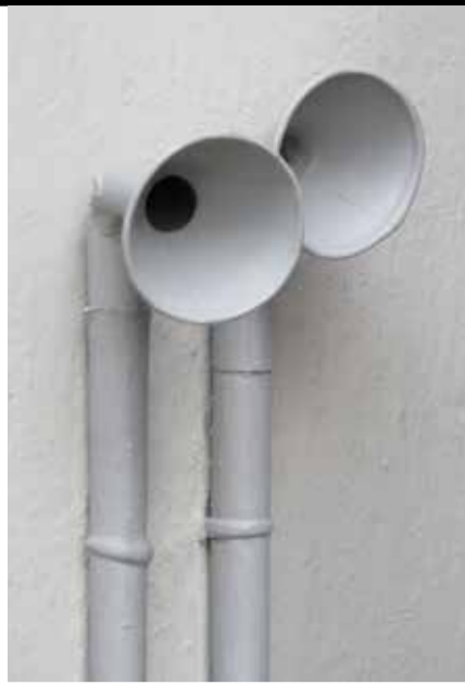
Een voorbeeld van een systeem met metalen spreekbuizen voor interne communicatie in een woonhuis.