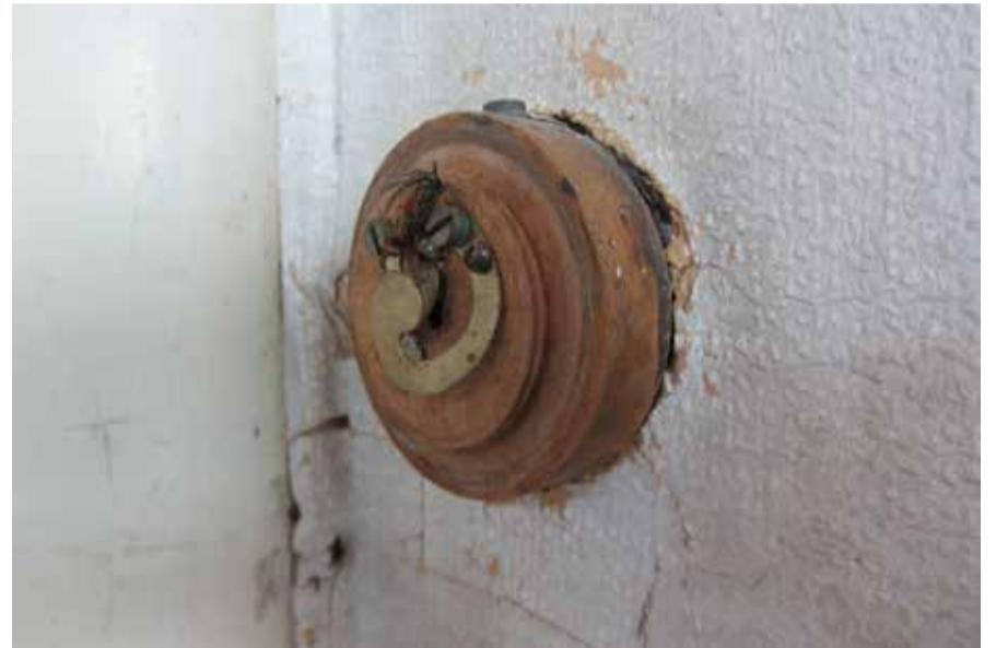
Dezelfde drukknop als de linker afbeelding, maar waarbij de houten behuizing is losgedraaid en de verende plaatjes zichtbaar zijn die een gesloten stroomkring maken wanneer op de knop gedrukt wordt.