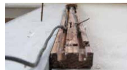
Voorbeeld van een 'geploegde houten lijst' voor het aanbrengen van elektrische bekabeling.