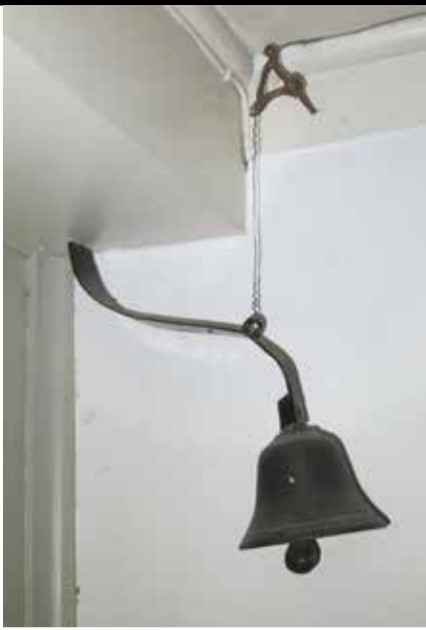
Een deel van een eenvoudige trekbelinstallatie.