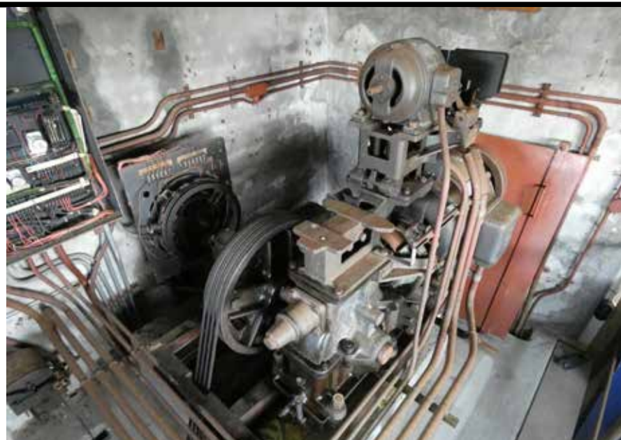
Een liftmachine uit 1936. Een wonder van techniek. Deze liftmachine staat bovenop de liftschacht. Er zijn ook liftmachines die onderin de liftschacht staan.

Voorbeeld van een normaaldozensysteem waarvan de onderdelen in dezelfde kleur zijn meegeschilderd als de houten vloer.