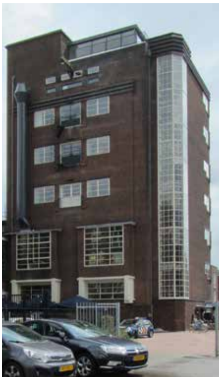
Het Brouwhuis uit 1929 met op de gevelhoek de liftschacht.