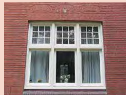
Dit raamkozijn, incl. ramen, glas en binnenbetimmeringen is nog geheel gaaf (= compleet) aanwezig vanuit de bouwtijd en is daarmee een historisch venster met een hoge bouwhistorische waarde.

Zijn de vensters niet historisch, maar dragen ze wel bij aan het karakter of beeld van het gebouw? Bijvoorbeeld een goed nagemaakte, recente kopie van een historisch venster. Dan is alleen het beeld of uiterlijk van waarde, niet het materiaal. Vervangen van het materiaal is dan een optie, als het uiterlijk daarbij niet wijzigt.