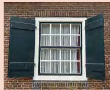
Een historisch venster waarbij het schuifraam in recente tijd is vervangen en zorgvuldig gekopieerd. Het schuifraam heeft als historisch beeld een hoge waarde, het materiaal van het schuifraam heeft geen historische waarde.