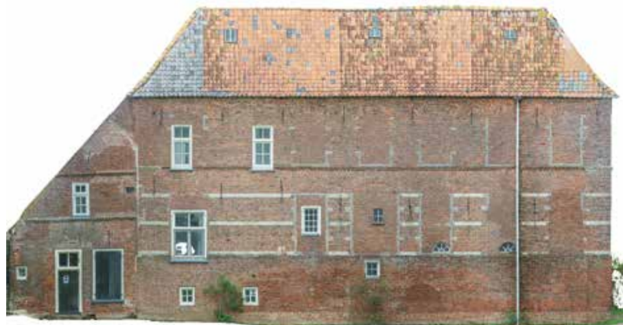
De gerealiseerde orthofoto van de zuidwestgevel, gemaakt door HighScan Drone Solutions in combinatie met Pelser&Hartman.