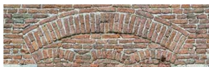
Ook is het mogelijk om van elk willekeurig deel van de gevel een uitsnede te maken als illustratiemateriaal in de rapportage.