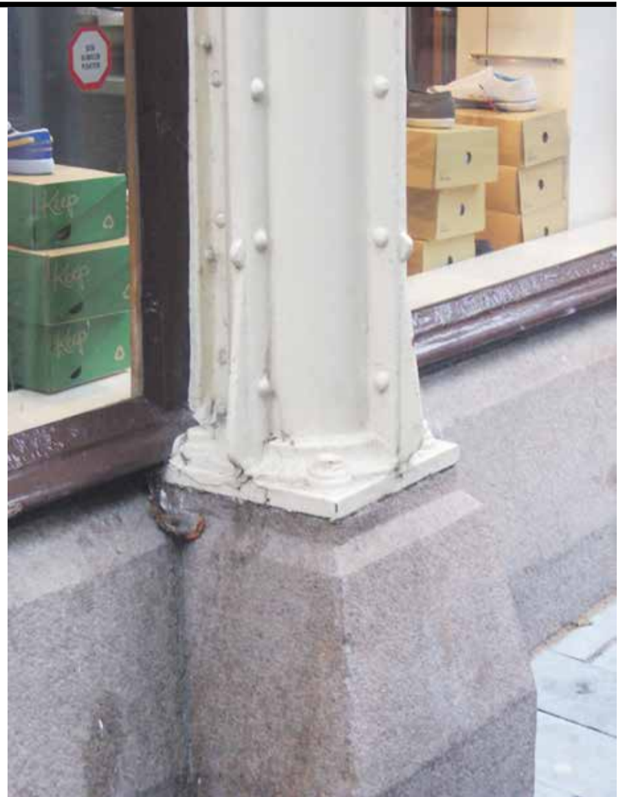
Een voorbeeld van kwadrantijzer.

Deze vier doorsnedes komen uit het boek van L. Zwiens, 'IJzerconstructies' uit 1908. fig. 139 = kwadrantijzer. fig. 140 = kwadrantijzer met tussengeklonken staven platijzer voor een groter traagheidsmoment en voor een 'gemakkelijke' aansluiting met andere aansluitende constructieonderdelen. fig. 141 en 142 = idem, echter dan zijn het geen kwadrantijzers, maar schuine gootijzers.