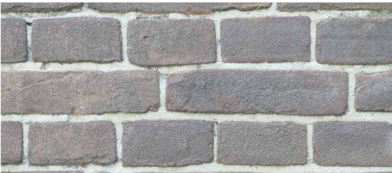
Een voorbeeld van machinale vormbaksteen.