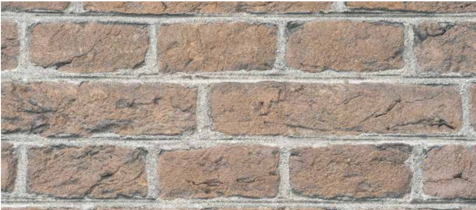
Een voorbeeld van handvormsteen met de kenmerkende groeven en nerven.